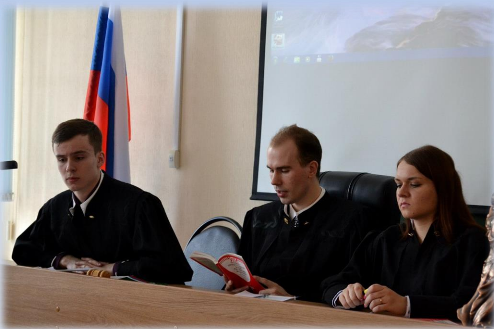
Зал судебных заседаний (учебный)