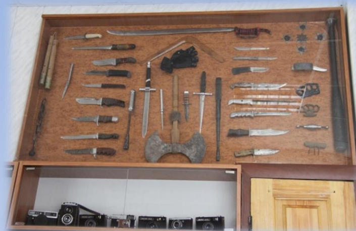
Криминалистическая лаборатория (учебная)

Юридический институт в составе Пензенского государственного университета был создан в 1998 году.